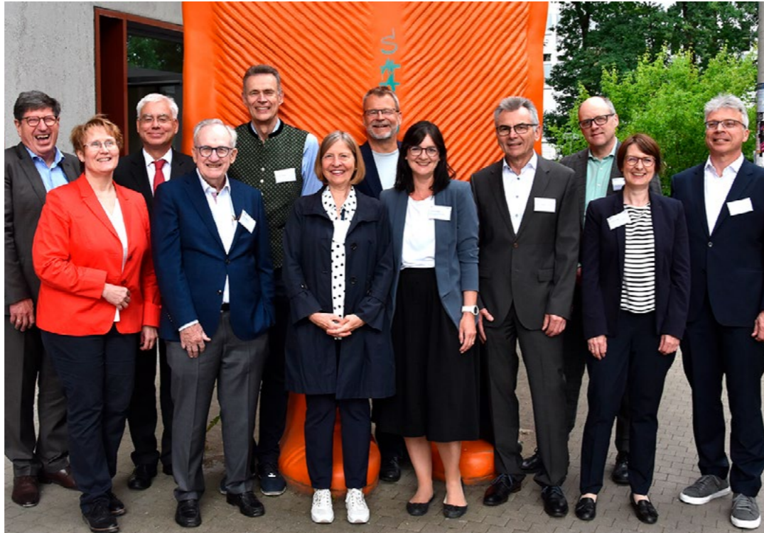
Gemeinsame Sitzung von Kuratorium und Ehrenversammlung der Stifterinnen und Stifter der KIT-Stiftung am 12. Juni 2024.

Im Jahr 2023 blieb die Ehrenversammlung in ihrer Zusammensetzung unverändert bestehen.